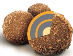
1 µm Microparticules magnétiques avec Streptavidine

Ainsi la conception innovante de NOVEOS permet d'éviter les interférences et d'obtenir des résultats précis pour les tests d'allergie.